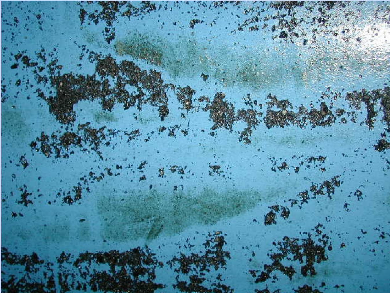
Aufgeweichte, z.T abgelöste Beschichtung