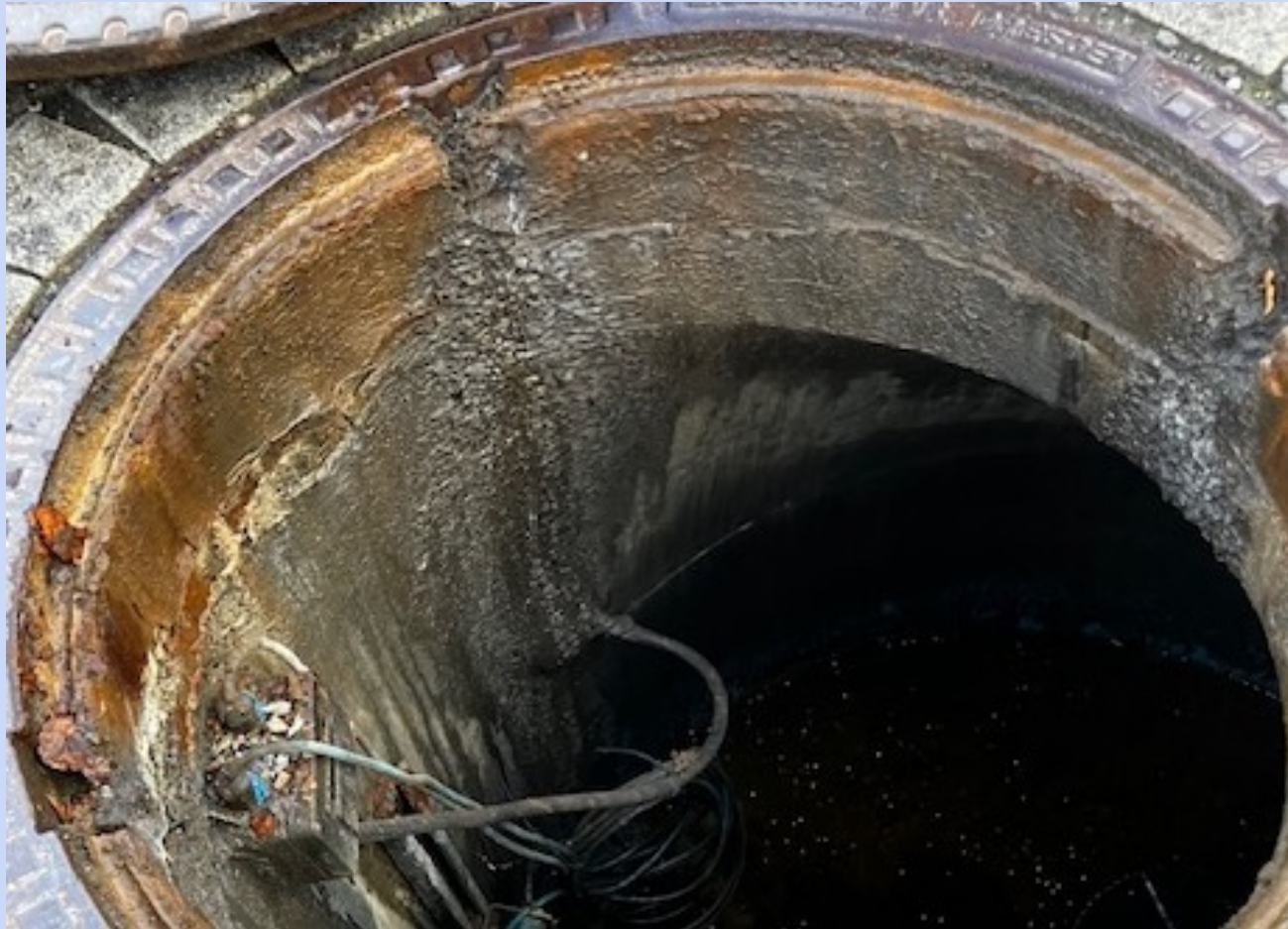
Fugen im Schachtaufbau eingerissen